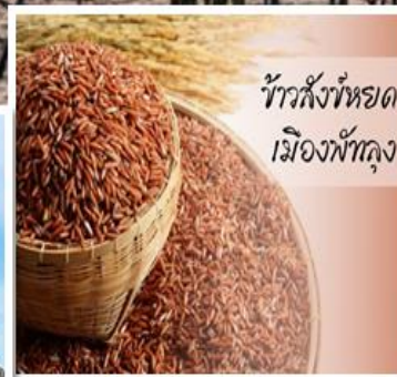
ข้าวสังข์หยด เมืองพัทลุง